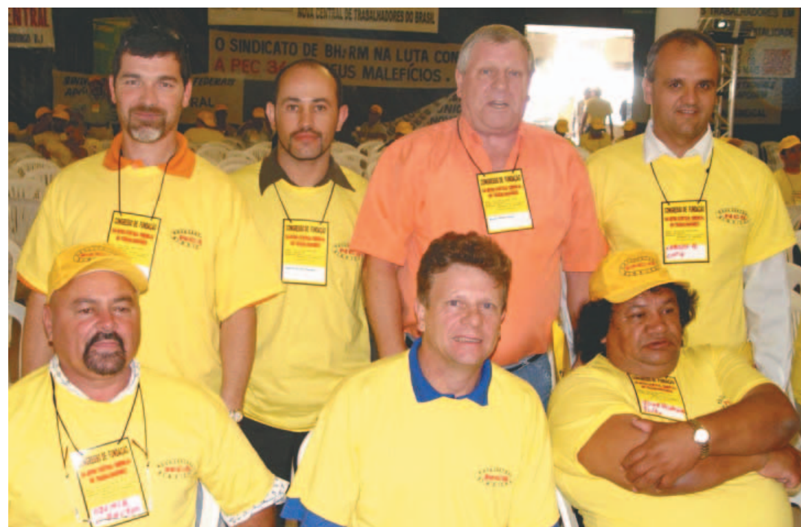
Membros da diretoria do Sindicondutores participaram, em Brasília, da fundação da Nova Central Sindical de Trabalhadores

Mais de 5.000 mil dirigentes sindicais de todo Brasil estiveram em Brasília, no final do mês de junho, para a fundação da Nova Central Sindical de Trabalhadores (NCST).